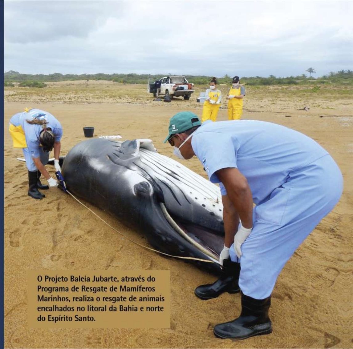
O Projeto Baleia Jubarte, através do Programa de Resgate de Mamíferos Marinhos, realiza o resgate de animais encalhados no litoral da Bahia e norte do Espírito Santo.

Monitorar os encalhes permite identificar as ações humanas prejudiciais a estes animais, avaliar o estado de saúde de suas populações e definir as ações essenciais para o manejo e a conservação destas espécies.